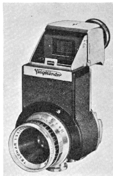
Spejlreflekshuset til Prominent med Telomar 15,5/100 mm

Egentlig 2 systemer, nemlig med spejlhusrefleks og med koblet afstandsmåler. Foruden standard brændvidden 50 mm, der præsenteres af Color Skopar f/3,5, Ultron f/2 og Nokton f/1,5, leveres nu spejlreflekshuset med teleobjektivet Telomar 100 mm med forskellige forsatslinser samt tele- objektivet Dynaron f/4,5 100 mm og storvinkel- objektivet Skoparon f/3,5 35 mm, der begge er koblede direkte til afstandsmåleren! Spejlrefleks huset har desuden mange anvendelsesmuligheder i forbindelse med næroptagelser, mikroskopiske optagelser og lignende.